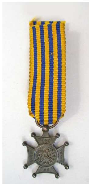
Lombokkruis, miniatuur versie. Opschrift voorzijde: LOMBOK / MATARAM / TJAKRA-NEGARA / 1894. Opschrift achterzijde: HULDE AAN / LEGER / EN / VLOOT.