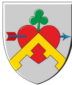
Familiewapen Neeb 3