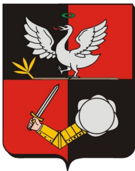
Familiewapen Von Schmidt auf Altenstadt 1